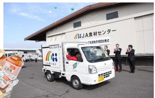
▲ 生活総合宅配出発式