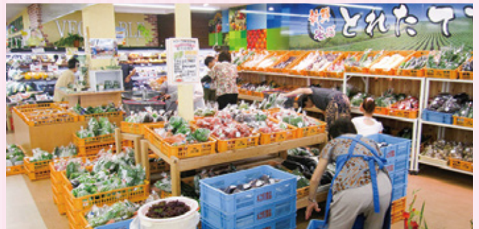
直売所には、旬な青果物が彩り豊かに並びます。