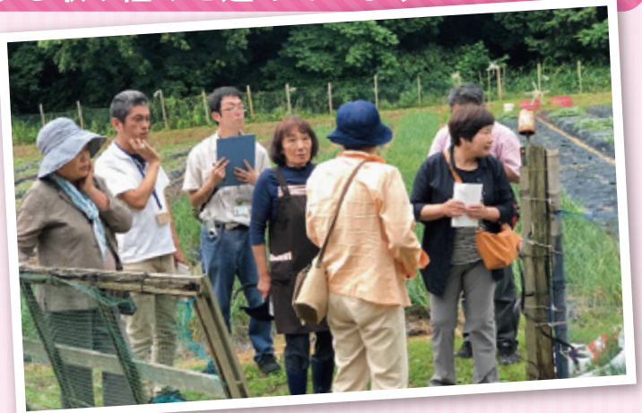
優良生産者ほ場視察(雲南市加茂町)

購入者からの「生産者の顔が見えて、安心して食べられる」「野菜本来の味がする」といった声は、生産者の生産意欲の向上、生きがいにもつながっています。