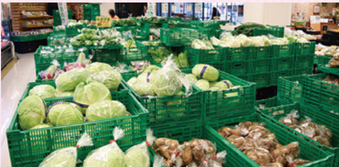
生産者の顔が見える売り場として喜ばれています。