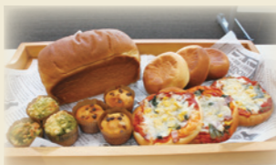
販売予定の米粉パン(イメージ)

この新規出店計画は、東海三県のJAで初となる農林水産省の「6次産業化・地産地消法に基づく総合化事業計画」の認定を受けています。イートインブースを設置した店舗内では、地元米の米粉を使用した米粉パンを製造・販売します。 地元の米や農畜産物の消費拡大を図り、農業者の所得増大と地域の活性化をめざします!どうぞご期待ください!!