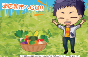
JA愛知西オリジナルキャラクター「レン」