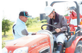
塾生にトラクターの操作方法を教えるJA職員(左)