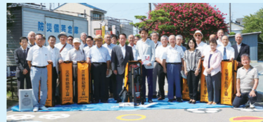
一宮市貴船小学校で救命工具セットを寄贈