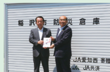
大里東市民センターへ防災倉庫を寄贈