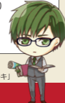
JA愛知西オリジナルキャラクター「レキ」

食パン、惣菜パン、菓子パン、デザートパンなどの米粉パンは、重量比の80%を地元産の食材で作ります。発酵の回数や時間を調整することで、米粉特有のもっちり感を残したままふっくらと焼き上げます!