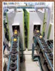
▲改修された選果機

平成29年度より果樹等総合集出荷場の改修工事を開始し、平成30年度より稼働を開始しました。今回の改修によって優品選果ラインやターニングコンベヤの増設をし、選果効率の向上、スムーズな箱詰め作業が可能となりました。これを機に更なる産地維持・拡大に繋げてまいります。