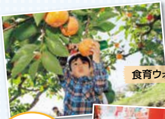
食育ウォーキング

ところで地域農業の応援団になるためにはどうすればいいのでしょうか？これは難しいことではありません。例えば「豊橋の農業を応援したい」という気持ちがあるだけでも立派な地域農業の応援団です。そのほかJAの農業関連商品(いちご狩り特典付定期貯金などの利用や女性部による料理教室、地産地消ウォーキングへの参加など、地域農業を応援する方法は沢山あります。皆様もこれを機会に豊橋の農業を応援してみませんか？