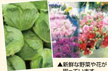
▲新鮮な野菜や花が揃っています

豊橋の農畜産物を購入することはなによりも地域農業の応援に繋がります。豊橋では数多くの品目の野菜や花、畜産物が生産されており、それらはJA豊橋のお店で購入することができます。ぜひお店へ足を運んでいただき、豊橋のおいしい農畜産物を購入してみてください！