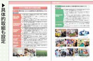
▶検討委員会の様子