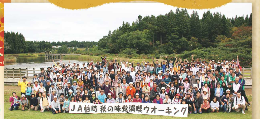
J A 柏崎 秋の味覚満喫ウォーキング