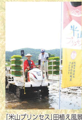
「米山プリンセス」田植え風景

柏崎市が米販売の競争力を強めようと新たに設けたブランド米「米山プリンセス」。J A ではブランド力を高めるため農業者への技術指導や出荷の支援のほか、販路確保に協力しています。