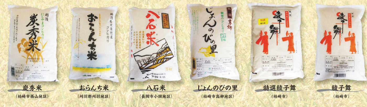
炭秀米 (柏崎市西山地区)

このほか、7割減減米、化学肥料、化学合成農薬を通常の栽培より7割減らした環境にやさしく作っています。