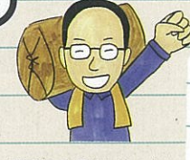
理事長の「けんちゃん」