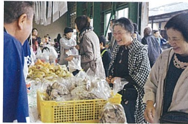
▲ 中野小屋支店の一支店一協同活動

「食」「農」「地域」を結ぶ地域貢献活動として、組合員と地域住民の絆づくりに向けた支店協同活動を実践しています。JAの拠点となる支店が中心となって各種イベントを実施し、結びつきや絆を強化する活動を支援します。