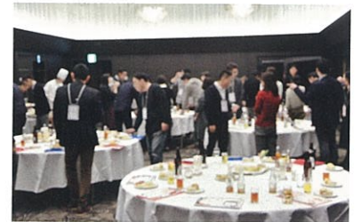
▲ よい食カレッジ「食×農de晩餐会」