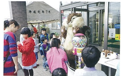
▲ じろね南支店の一支店一協同活動