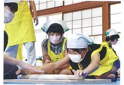
▲ 阿賀地区でのそば打ち体験 (あぐりスクール)