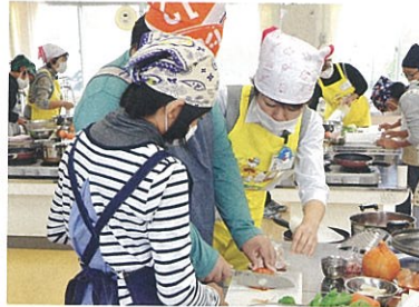
▲ 地産地消調理実習 (出前授業)

小学生を対象にあぐりスクールを募集・実施し、地域の素晴らしさ、食材の豊富さを認識してもらいます。また、管内の小学校へ出前授業を実施し「地産地消」に対して理解を深める食農教育を進めます。