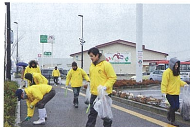
▲ 地域清掃ボランティア

交通安全街頭活動への参加や、事業活動を通じて高齢者世帯への声掛けを実施しています。また、よい食カレッジ (婚活イベント) を年2回実施し、若手農業者の出会いを支援しています。