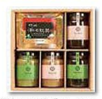
甲賀のお茶ジャムセット