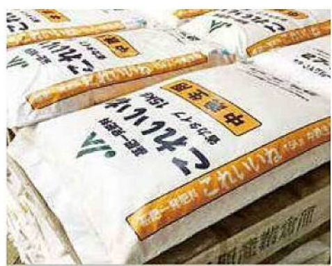
一発肥料「これいいね」