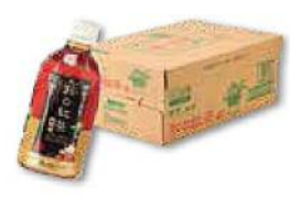
甲賀のお茶(和の紅茶)