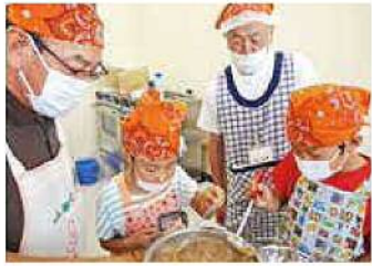
ちゃぐりん(食農教室)&男性料理教室