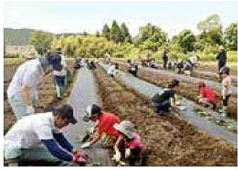
農業体験付定期積金 「わくわくパック」活動風景