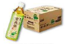
甲賀のお茶(玄米茶)