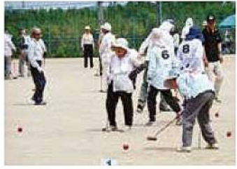
元気倶楽部ゲートボール大会