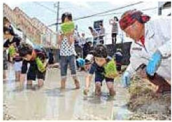
田植え体験学習会(小学校)