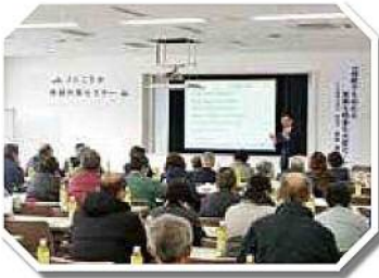
相続対策セミナー

① 渉外担当者による恒常的な訪問活動や、全職員による月1回の組合員訪問活動を通して各種相談に対応しています。 ② JAごうかの各事業に関する相談をはじめ、年金相談会、休日ローン相談会、無料税務相談会、相続セミナー、財産診断による相続相談会などを多数開催しています。