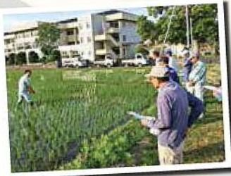
▲あぜみちモーニングスクール(水稲研修会)

今般、自己改革の取り組みの一部ではありますが、第14次3カ年計画（中期計画）の取り組み状況につきましてお知らせをさせていただきます。これまでも、そしてこれからもJAこうかは組合員の皆さまとともに改革を継続してまいります。