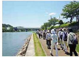
女性部「健康ウォーキング」

利用者組織の活動や女性部の活動を通して食農教育活動や健康づくり活動などに取り組んでいます！