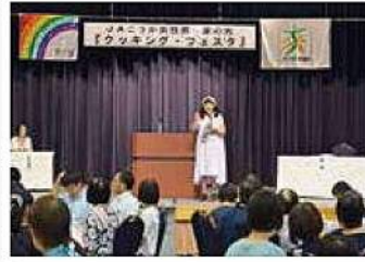
女性部「家の光」[クッキングフェスタ]