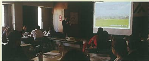
◀講師を務めたJA福岡市の堀係長