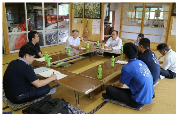
（経営コンサルチームによる農業経営コンサルの様子）