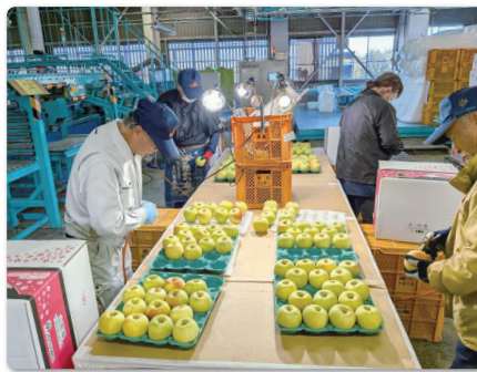
広域選果施設での選果作業

JAは、国の輸出拡大支援に関する事業を活用して、朝日町に広域選果施設を22年に新設しました。これにより、輸出向けのリンゴを大口ロットで集荷できるようになりました。品種は「シナノスイート」や「ふじ」など4品種で、輸出量は同年、前年の4倍以上となる210トン、輸出向けの販売額は6倍以上の9100万円に急増しました。