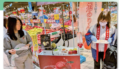
現地店舗での販促の様子

また、全農グループのバリューチェーンを活用した輸出産地づくりの取り組みと連携し、台湾向けりんごの輸出を着実に増やしており、今後も連携を強化してさらなる輸出拡大を目指します。