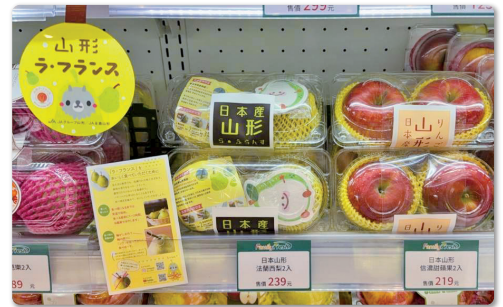
輸出先の店舗に並ぶリンゴ

一方、輸出に対応していたのが朝日町にある選果場だけで、台湾でニーズの高い大玉果の量を確保しにくいことや、処理能力が課題でした。