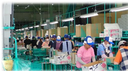
（かのいわ中央共選所の選果風景）