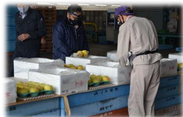
(輸出用りんごの検査官による検疫検査) (検査合格品 港までのトラック積み込み)

これらの取り組みにより、2015年度から2019年度にかけて、対象農家 1戸当たり5.9%の所得増大を実現 しました。