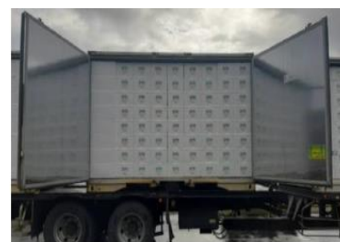
(統一規格の発泡スチロールによるトラックへの積み込み)