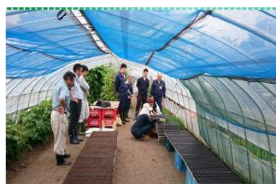
(相談員の指導風景)